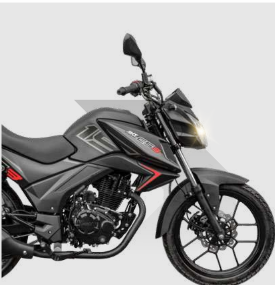
|| NEGRO MATE